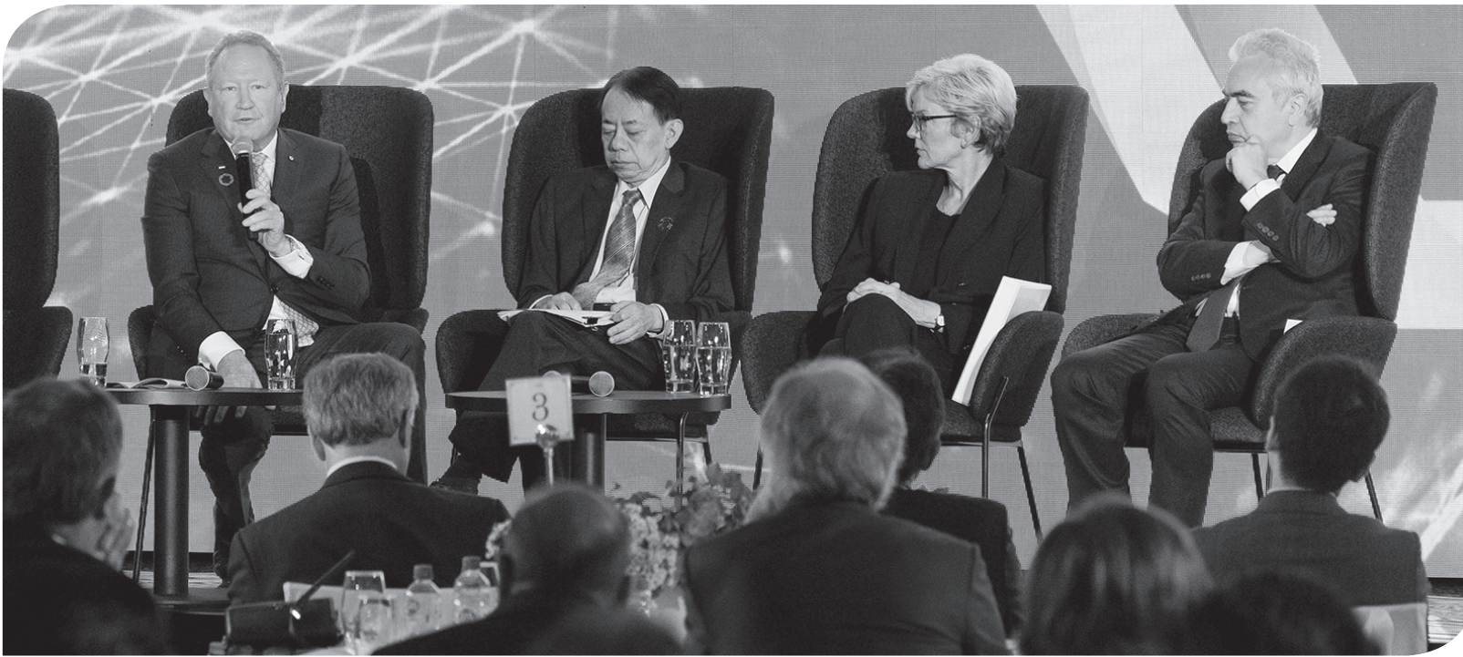
FORUM ENERGI SYDNEY - AUSTRALIA

Ketua dan Pendiri Fortescue Metals Group Andrew Forrest, Direktur Eksekutif Badan Energi Internasional Fatih Birol, Menteri Energi AS Jennifer Granholm, dan Presiden Bank Pembangunan Asia Masatsugu Asakawa di Forum Energi Sydney, di Sydney, Australia, Selasa (12/7).