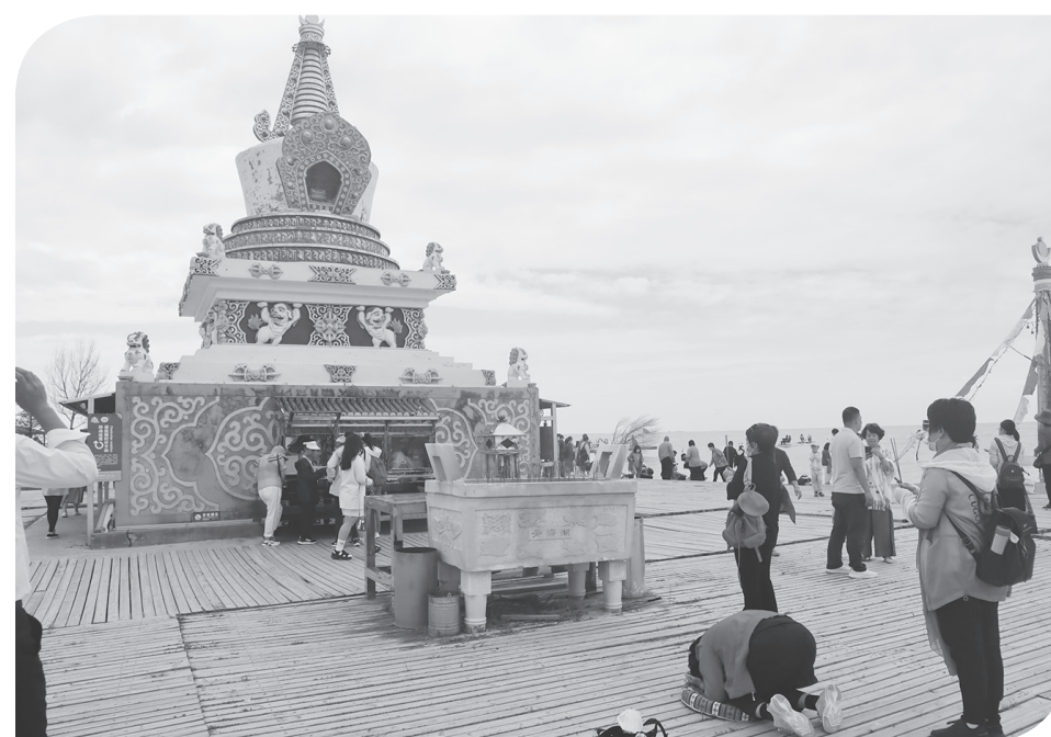
WISATA DANAU QINGHAI TIONGKOK

Militer Rusia belum berkomentar atas klaim Ukraina yang membunuh seorang jenderal Moskow dengan HIMARS Amerika. Namun, Kremlin selama ini mengancam tindakan Amerika yang memasok sistem roket canggih itu kepada Kiev. ● ans